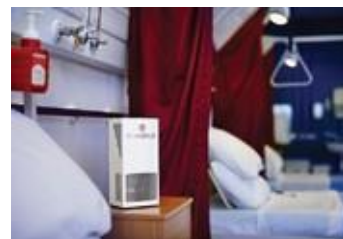
Soba za pacijente